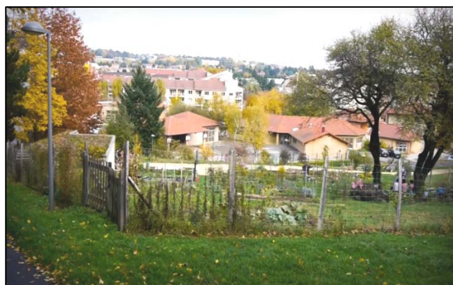
Jardin et quartier des Barolles

Aidés au départ par le centre social et l'association « Pass Jardins », les habitants usagers ont ensuite créé l'association « Pause-Jardin » et prennent largement en charge la gestion et l'animation du site, qui est ouvert à tous les habitants du quartier. En 2011, en plus des cotisations, l'association a réalisé des interventions et animations qui ont été rémunérées à hauteur de 450 euros.