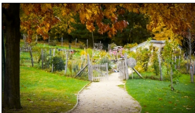
Jardin des Barolles

Le jardin des Collonges , est né de l'initiative de la maison de quartier des Collonges, dont une animatrice se chargeait de trouver des bénévoles aidants, de réaliser des animations (ex : avec des « papy-jardins »), et d'organiser la gestion du site (ex : planning d'arrosage).