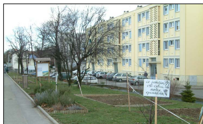
Jardin des Collonges

Aujourd'hui, l'association est en restructuration et le jardin est en attente d'une reprise par la nouvelle association de quartier.